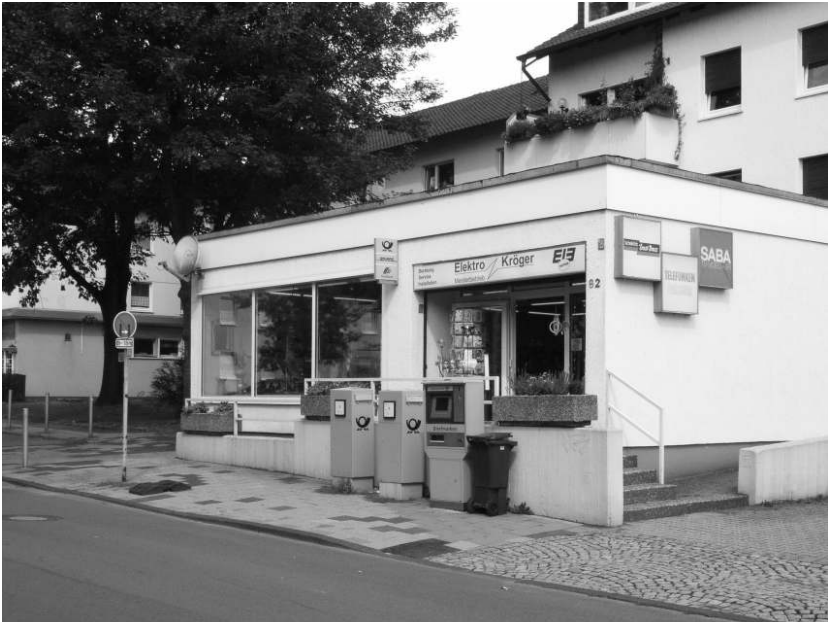
Postagentur Herdecke-Kirchende, Kirchender Dorfweg 82